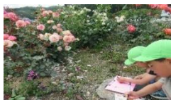
ばらの絵を描いたよ！