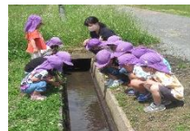
《お姉さん先生だーい好き！楽しく遊んだよ》