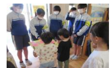
《プレゼントをもらったよ》