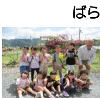
ばら組・さくら組